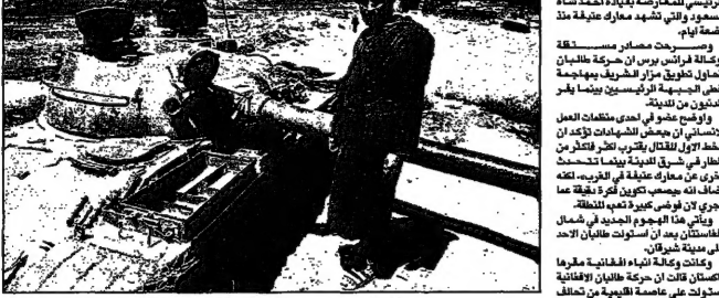
مقاتل طالبان بجانب حربة فردية حيث كرس قبلي كابل (دور)

■ كابل - طالبان مستعدون لتقديم عفو عن المعارضين الذين شاركوا في القتال مع القوات الحكومية في كشمير، وذلك بعد أن وافقت القوات المسلحة الهندية والباكستانية على التوقيع على الاتفاقية التي وافقت عليها القوات المسلحة الهندية والباكستانية في 1996. وقالت الهند والباكستان إنهما وافقتا على وقف إطلاق النار في كشمير، وذلك بعد أن وافقت القوات المسلحة الهندية والباكستانية على التوقيع على الاتفاقية التي وافقت عليها القوات المسلحة الهندية والباكستانية في 1996.